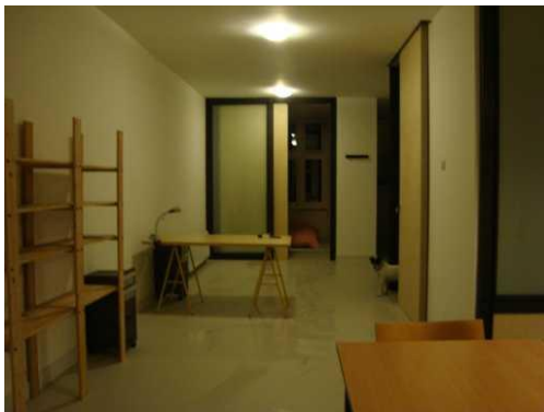
De Artist in Residence ruimte

In het totale Rotterdamse aanbod bleek behoefte aan een extra vorm van verblijf voor kunstenaars die langer dan 3 maanden wil blijven. De nieuwe voorziening CK12 biedt de mogelijkheid om een half jaar tot een jaar in een gastatelier te wonen en te werken. Tijdens dit verblijf kan de kunstenaar zijn persoonlijke ontwikkeling verdiepen. En in samenwerking met de gastorganisatie en de omgeving een intensere samenwerking aan te gaan. Inherent aan de locatie van de residentie, is dan ook de voorwaarde dat de kunstenaar geïnteresseerd is in de wisselwerking tussen zijn of haar kunst en de (stedelijke) omgeving.