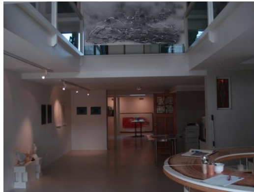
Kunstenaars die meedoen met de tentoonstelling Art=ARRV komen aan bij Hommes met hun kunst Januari 2008