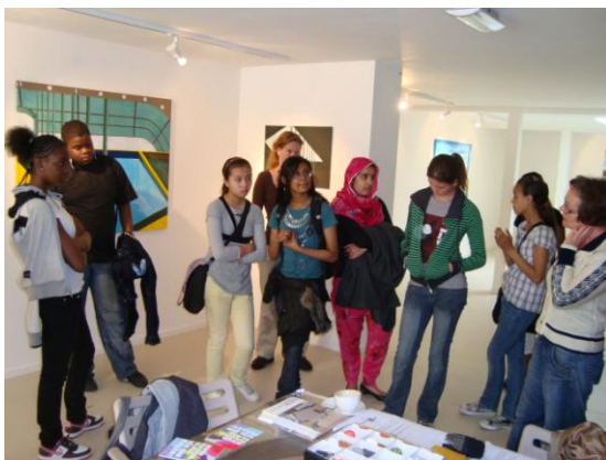
Leerlingen die meedoen aan de Jeugd Masterclass Ich bin Maler! Maart 2009

De expositieruimte zal in tentoonstellingsperioden, gedurende drie dagen per week geopend zijn, en daarnaast op afspraak.